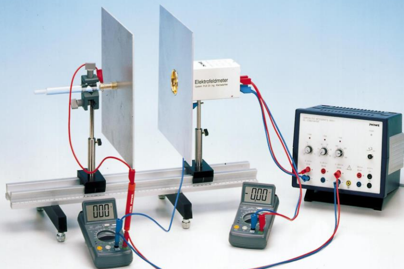
Интензитет на електрично поле