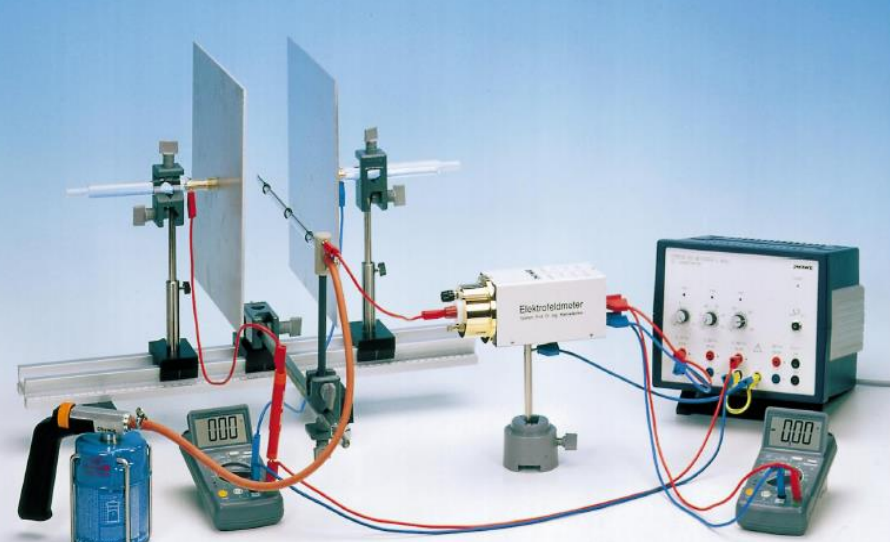
Потенциал на електрично поле