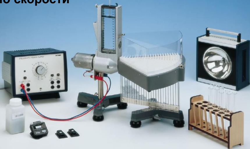
Разпределение на Максвел на молекули по скорости